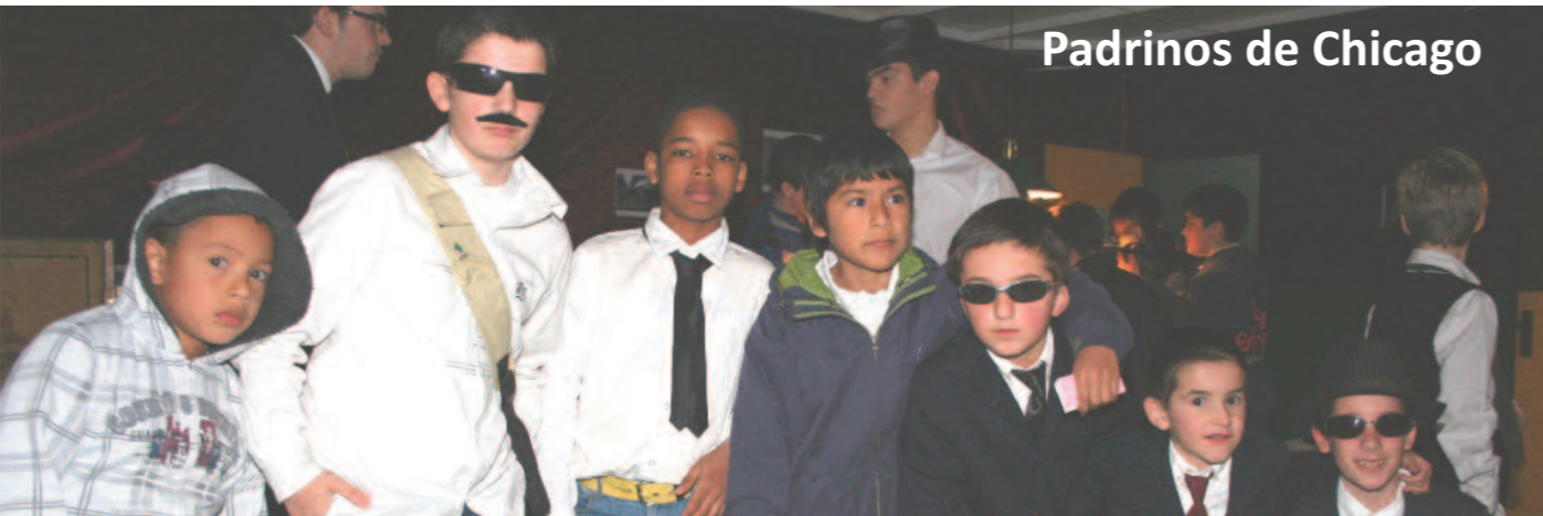
Padrinos de Chicago