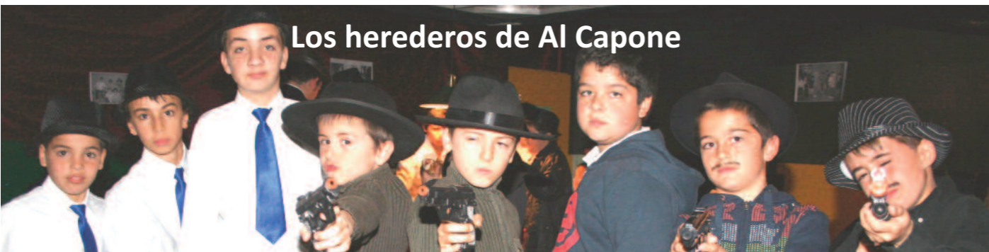
Los herederos de Al Capone