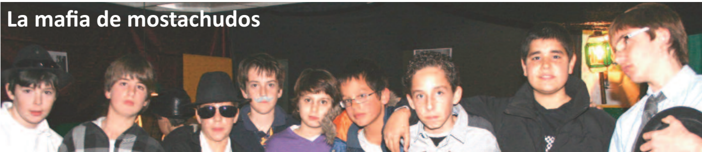
La mafia de mostachudos