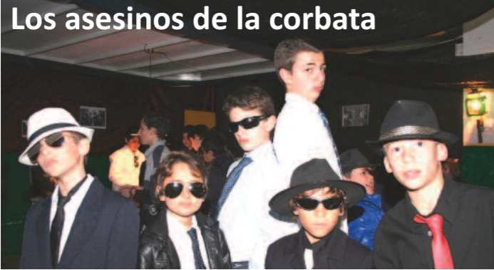
Los asesinos de la corbata