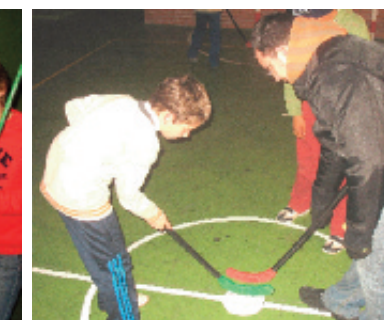
Los de 5º también estuvieron entrenando para la DECA.