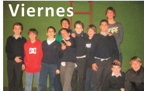
Los capitanes de la DECA entrenaron a basket