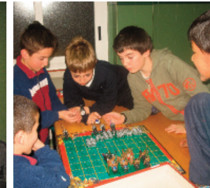
Los de 5º, buenos estrategas