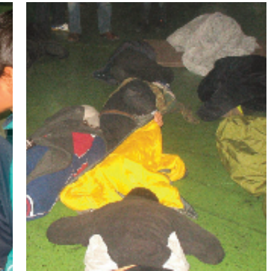
En pleno Focos alemanes

Empezó algo despistado, pero pronto se entonó y protagonizó vistosas jugadas por la banda. JON