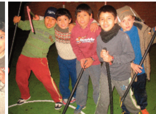
Practicaron hockey, baloncesto y fútbol.