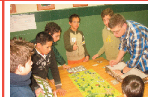
Demostraron sus dotes estratégicas en este juego de la II Guerra Mundial